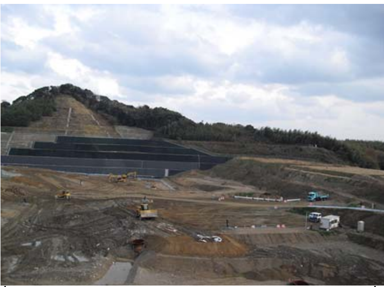
写真（上）：研修会 写真（下）：西部（中田）埋立場

底部集排水管及びガス抜き管を適切に管理し、浸出水の排水及び処分場内の通気性を確保することが重要であること、それにより好気性分解が促進され、水処理など維持管理コストの低減化につながっていることが説明されました。