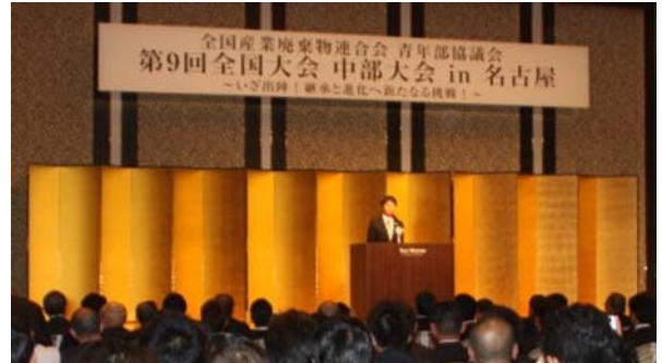
写真(上)：挨拶する加山青年部協議会会長 写真(下)：全国大会のもよう